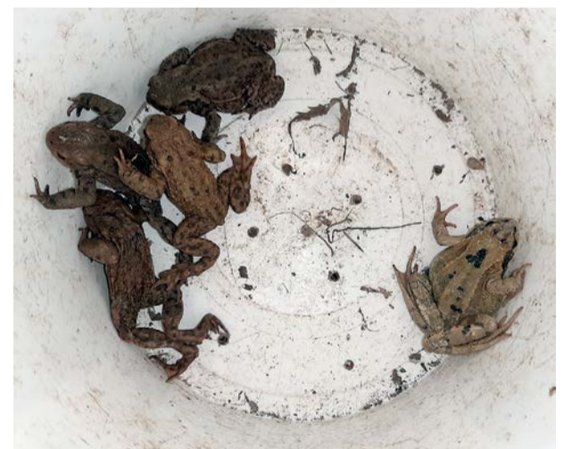
Vier Erdkröten und ein Grasfrosch warten auf den Taxidienst.

Über die Details werden wir Sie dann bald möglichst informieren.