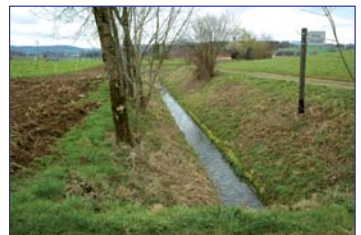
In Schalen gelegter Tobelbach